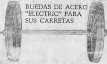
RUEDAS DE ACERO "ELECTRIC" PARA SUS CARRETAS

TARIFA inserción. Minimum 20 palabras y cuatro inserciones. 5 centimos por palabra cada