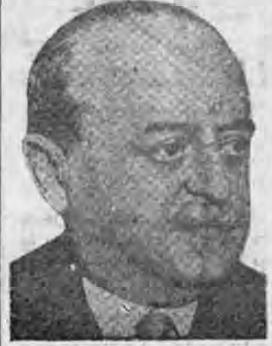
General OSCAR BENAVIDES